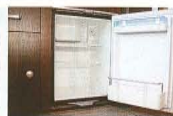
40Lの容量を持つ冷蔵庫。標準で装備する。