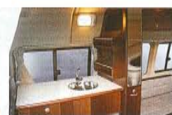
調味料などの収納棚も便利なギャレー回り。