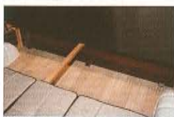
最後尾のシート下の収納にはラゲッジからアクセス可能。

Dainette 落ち着いた感じの家具の採用や間接照明などでシックな雰囲気の内室。ギャレー部分を前側に配置し、リア側にダイネットをレイアウト。ゆったりとした空間は2人で過ごすのにピッタリ。