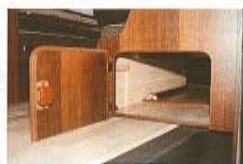
ダイネットのシート下は収納スペースになっている。