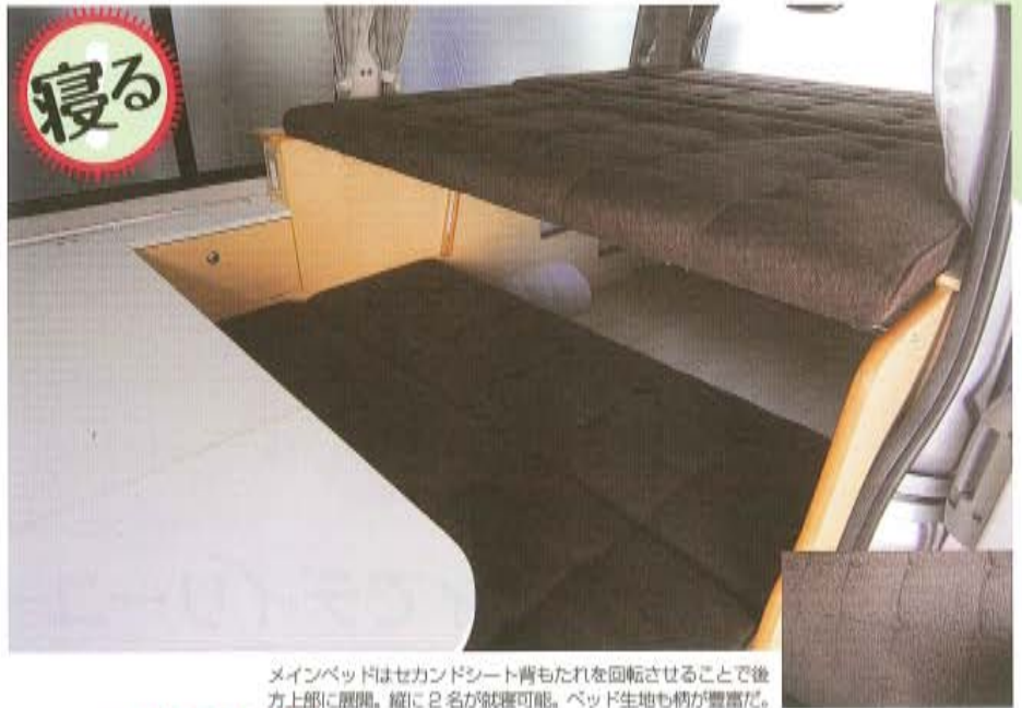
メインベッドはセカンドシート背もたれを回転させることで後方上部に展開。縦に2名が寝る可能。ベッド生地も柄が豊富な。

1セカンドシート右上には収納ボックスを装備。2これはオプション装備だが、ルーフ後部には蓋付きの収納ボックスも。3リヤにはLED照明が装備され、白色のほかにもこのようにブルーにも変化。4運転席後部はカーテンも装備。5ルーフの照明はLEDを採用。長方形のメイン照明のほかにも丸形のドア連動照明も。6バックドアには換気用電動ベンチレーターを装備。