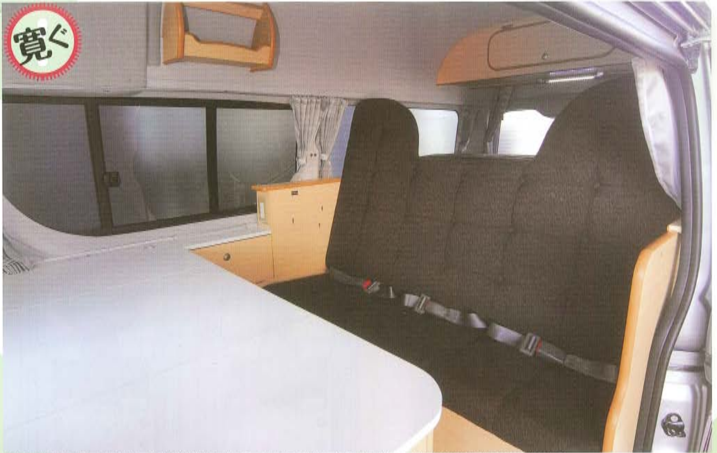
ダイネット時や走行時は、セカンドシートに3人が前向きで着座する。右側には100V用コンセントも装備され、前方にはシンクや冷蔵庫が設置されている。

HIACE-Based Camping Car Complete New Model