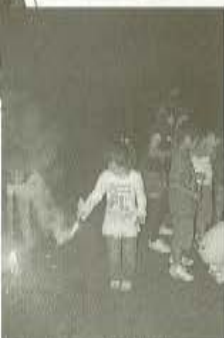
●ミーティングの締めくくりは花火。色とりどりの花火に大人も子供も酔いしれた