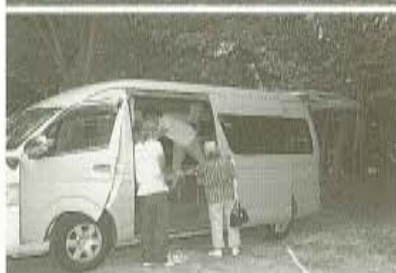
●最新モデルのファルトをはじめ、オリジナル車がずらっと並ぶ展示ブース。すでに持っている人も、買い替え検討中なのか、じっくりと見入っていた