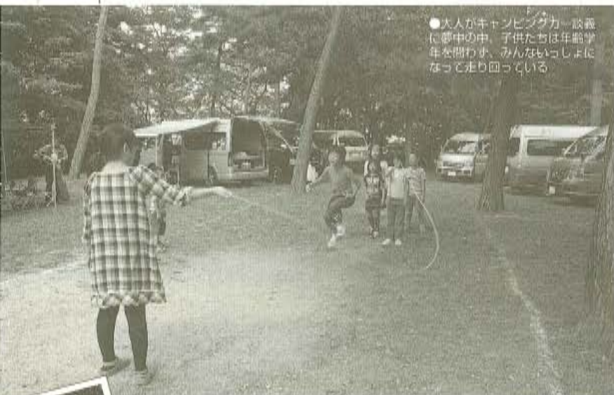
●大人がキャンピングカー談義に夢中の中、子供たちは年齢学年を問わず、みんないっしょになって走り回っている