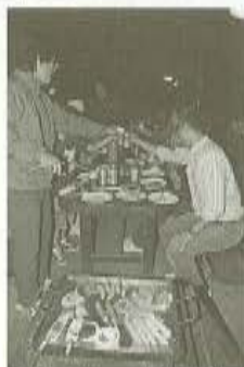
●バーベキュー場で行なわれた親睦会では、お肉や野菜、飲み物などがビークルより振る舞われた