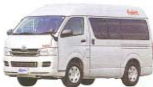
ファルト主要諸元

上段にセットされるベッドは、まさにワンタッチで背もたれを持ち上げるだけ。数10秒で2人なら快適で余裕の就寝スペースになる。下部はダイネットとは隔離された大型の収納庫で、あらゆる物の積載が可能だ。