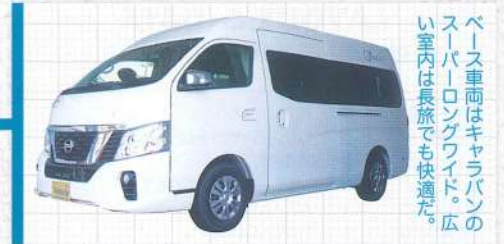
ベース車両はキャラバンのスーパーロングワイド。広い室内は長旅でも快適だ。