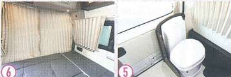
①スイッチ類はルーフにまとめられ使いやすい。②サブバッテリーや走行充電は標準で装備される。③冷蔵庫やシンクも標準装備。④セカンドシートは後ろ向きだけでなく前向きでもダイネットとして使える。⑤リアのマルチルームはトイレのほか収納として使用可能。⑥車中泊には欠かせないカーテンも標準装備している。

▼常設ベッドは長旅をするときにはうれしい装備。大きさも十分で大人がゆったりとくつろげる。