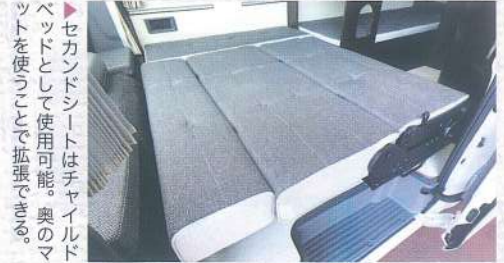
▶セカンドシートはチャイルドベッドとして使用可能。奥のマットを使うことで拡張できる。